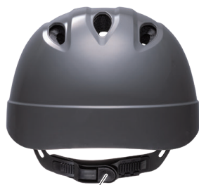
サイズアジャスター